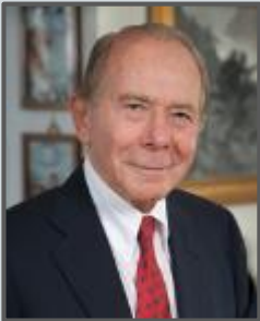
MAURICE R. GREENBERG